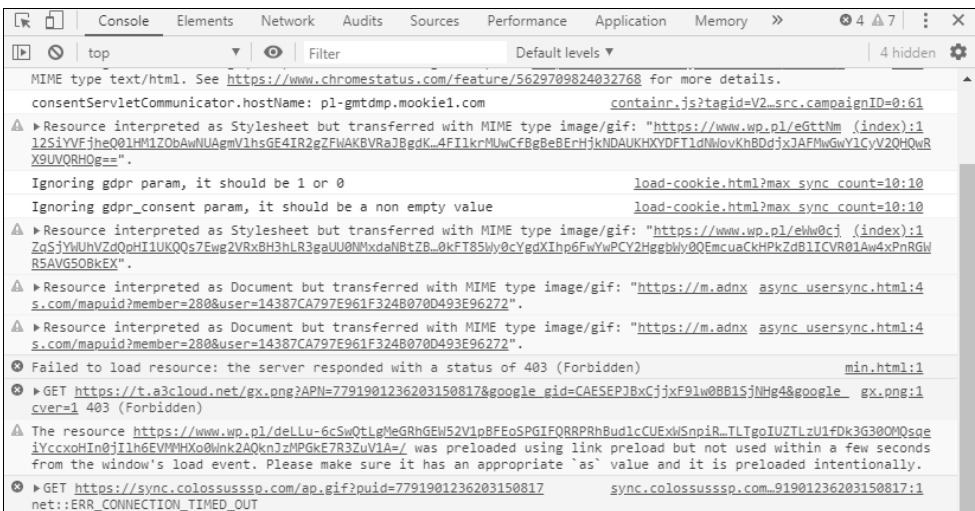
RYSUNEK 2.1. Zakładka Console

Obowiązkowo musimy natomiast analizować wszystkie komunikaty (w języku potocznym mówimy o tzw. logach) na poziomie Errors . Są to informacje wskazujące na błędy w naszej aplikacji. Rysunek 2.1 przedstawia przykładowy wygląd konsoli po wczytaniu strony internetowej. Widzimy trzy ważne dla nas komunikaty na poziomie Errors . Dwa pierwsze mówią o braku dostępu do pobrania wskazanych zasobów z serwera, a trzeci informuje nas, że dla próby pobrania danych ze wskazanego endpointu GET otrzymaliśmy odpowiedź negatywną ze względu na zbyt długi czas oczekiwania na odpowiedź serwera ( timeout ).